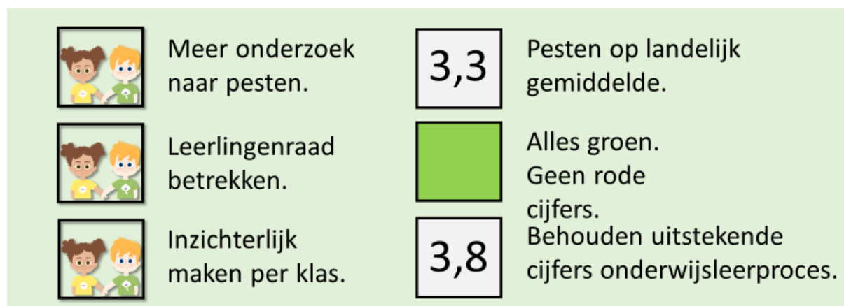
Fig.2 ambities leerlingenquête